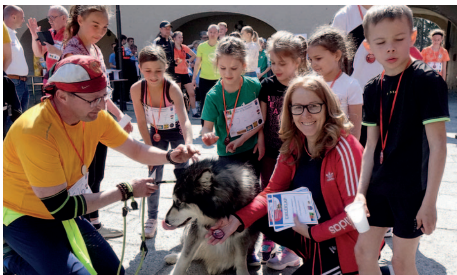
Népszerű a városnapon futóverseny.

Sok húr on játszik a város köztisztelőben álló, ötletgyáros képviselője.