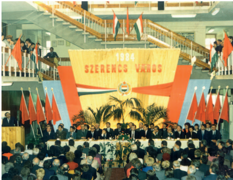
A városavató ünnepi tanácsülés 1984. január 11-én volt a gimnázium aulájában.

Szerencs városi rangjának visszanyerése 1984-ben komoly mérföldkő volt a település történetében. Az előző lapszámunkban már irtunk Szerencs és Ond múltjáról, a mostani cikkünkben az 1984. január 11-ei városavató ünnepséget részletezzük.