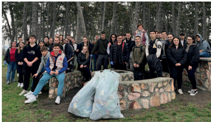
A diákok teljesen megtisztították a Fenyvest.

A Bocskai István Katolikus Gimnázium és Technikum tanulói március 1-én megtisztították a Fenyvest.