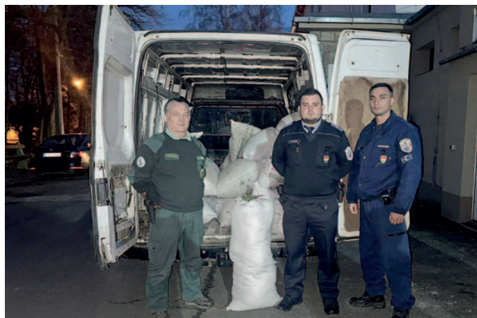
Zsákokba volt tömve az értékes védett növény.

A Szerencsi Rendőrkapitányság járőrei 2024. február 28-án délután – az Aggteleki Nemzeti Park Igazgatóság Természetvédelmi Őrszolgálatával együttműködve – megállítottak egy közúti ellenőrzésre egy tehergépkocsit, csekkolták annak sofőrjét, illetve utasát is. A furgon átvizsgálása során a járórok zsákokban, 260 kilogramm, engedély nélkül szedett mohát találtak. A járórok lopás vétség gyanúja miatt előállították a nyírbogdányi és besztercei férfit a Szerencsi Rendőrkapitányságra. Az eljárás eddigi adatai szerint az elkövetők Trizs külterületén, az Aggteleki Nemzeti Park védett természeti területén gyűjtötték az 1 millió 300 ezer forint értékű, védett növényt. Az ügygel kapcsolatban további eljárási cselekmények várhatóak, amelyeket már az Ózdi Rendőrkapitányság végez el.