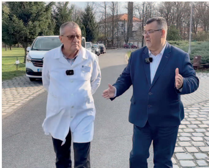
A helyszíni bejárásról videó is készült, ami a Szerencsi Hírek YouTube oldalán tekinthető meg.

új ultrahang készülék volt, ami rendkívül fontos a pontos diagnosztikában, de említhetjük akár az új műtőasztalt, szemészeti, urológiai és sterilizáló berendezéseket is.