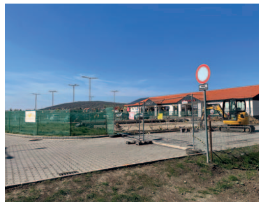
Megkezdődtek a Sinsay építési munkálatai.

Az LPP – egy lengyel cég, amely ruházati cikkek tervezésével, gyártásával és forgalmazásával foglalkozik. Őt ismert divatmárka tulajdonosa ezek a Reserved, House, Cropp, Mohito és a Sinsay amelyek kínálata elérhető mind tradicionális, mind online üzletekben. Az LPP weboldalán arról írnak, hogy mindegyik más-más életstílust képvisel, más-más módon kifejező és eltérő igényű vásárlói körhöz szól. „A Sinsay a legújabb trendeket vonzó áron kínálva válaszol ügyfelei igényeire. A márka kínálatában az egész családnak szóló termékek találhatók. A Sinsay termépalettáját lakberendezési cikkek, házi kedvencek számára készült kiegészítők, valamint smink- és bőrápoló sorozat egészíti ki” – olvasható az LPP weboldalán. Ma 21 országban van jelen több mint 900 hagyományos üzletből álló hálózattal és online áruházal.