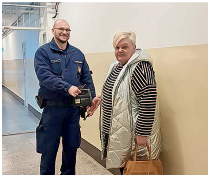
A rendőrök rövid időn belül visszaadták jogos tulajdonosának (fotónkon) az akkumulátortöltőt.

A férfi 2024. február 19-én Szerencsen, a Szemere Bertalan utcában az egyik családi ház udvaráról elvitt egy akkumulátortöltőt. Három órával később egy tállyai körzeti megbízott Szerencs külterületén felfigyelt egy férfira, aki, amikor meglátta a rendőrautót, megfordult, és látszott, hogy a ruhája alatt elrejtett valamit. A rendőr intézkedett a gyanúsán viselkedő emberrel szemben. Igazoltatása közben a férfi bevallotta, hogy lopta a pulóvere alá dugott akkumulátortöltőt, ezért előállította őt a Szerencsi Rendőrkapitányságra, és a nyomozók gyanúsítottként hallgatták ki. A rendőrök visszaadták az akkumulátortöltőt jogos tulajdonosának, aki nem is tudott arról, hogy ellopták.