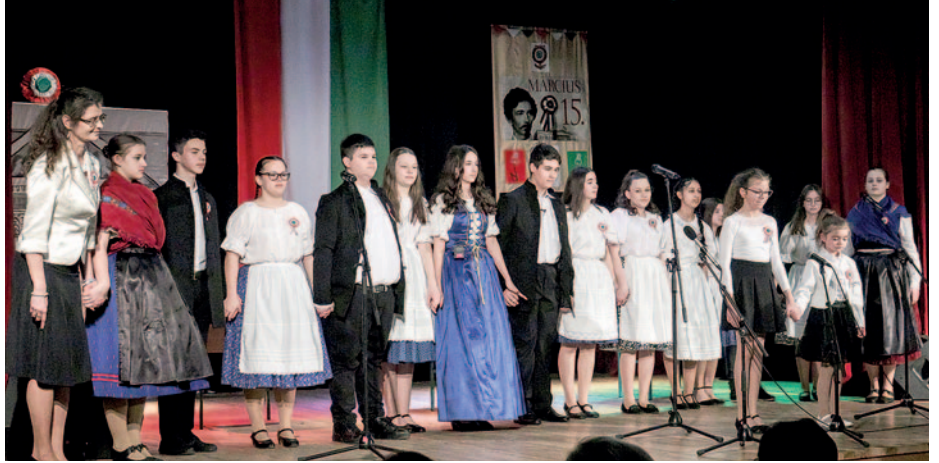
Az idén a Bolyai János Katolikus Általános Iskola diákjai adtak műsort.