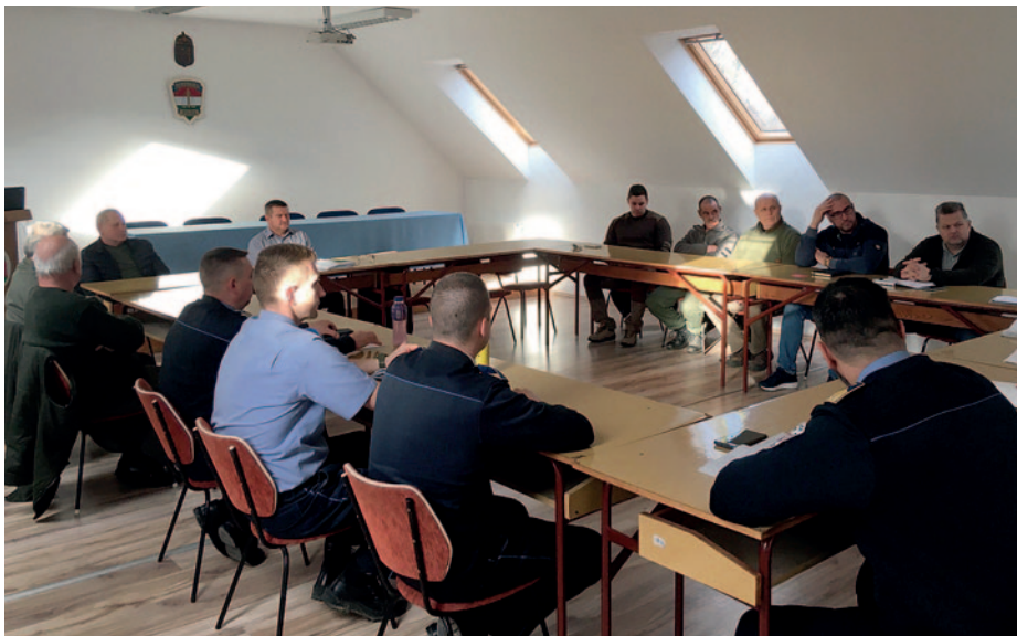
Rendőrök és mezőőrök egyeztettek.

Az illetékességi területen dolgozó mezőőrök és a kapitányság vezetői a tavalyi év tapasztalatait, valamint az idei év közös feladatait egyeztetették – olvasható a Borsod-Abaúj-Zemplén vármegyei rendőrség közösségi oldalán. A találkozón többek között a külterületeken elkövetett illegális személtlerakásokkal kapcsolatos hatékonyabb fellépés metodikája szerepelt, valamint külön napirendi pont volt a fa- és terménylopások megelőzésével, felderítésével kapcsolatos teendők egyeztetése. A kapitányság vezetése az eredményes együttműködés és a jó munkakapcsolat további erősítése érdekében a közös szolgálat és közvetlen kapcsolat lehetőségét ajánlotta, illetve megköszönte az elmúlt évi közös szolgálatot.