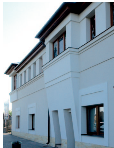
A bolt eredetileg az első világháború idején épülhetett.