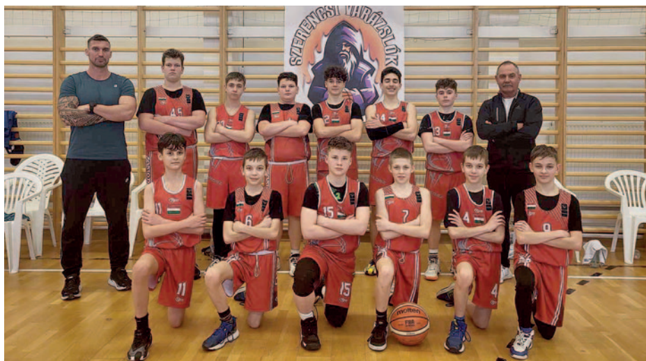
Veretlenül az első helyen végeztek.

Veretlenül, végig magabiztos játékkal az élen végeztek a fiatal kosárlabdázók.