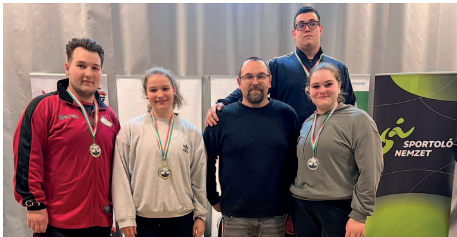
A sportolók ismét öregbítették városunk jó hírét.

Kiváló eredményekkel tértek haza a Savaria Kupa – XIII. Tóth Géza Emlékversenyéről a szerencsi súlyemelők.