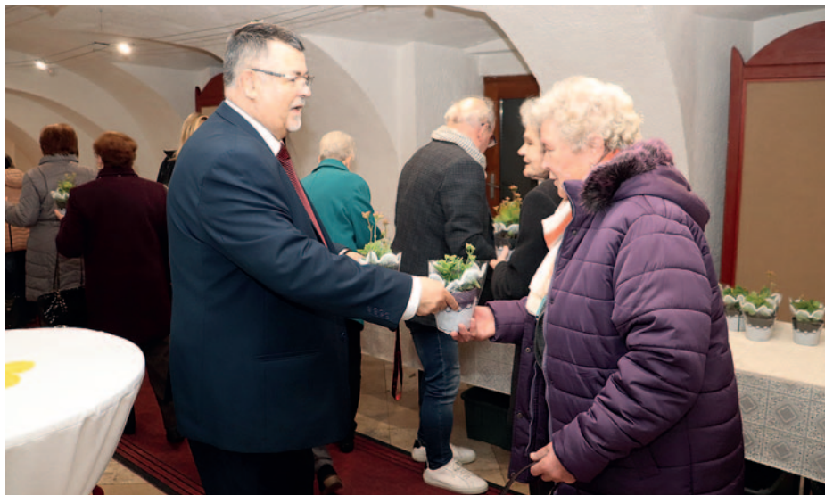
A hagyományoknak megfelelően a hölgyeknek virággal kedveskedtek.

Szerencs Város Önkormányzata a nemzetközi nőnap alkalmából március 8-án köszöntötte a város lányait, hölgyeit és szépkorú asszonyait a Rákóczi-vár színháztermében.