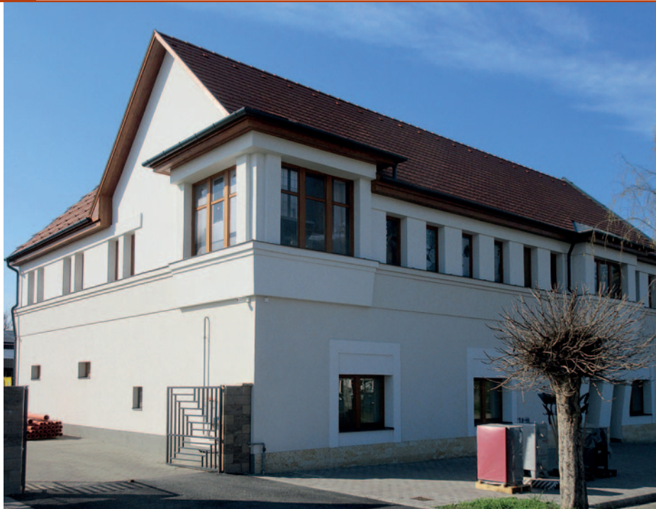
A megfelelő helyen lévő kiemelések teszik látványossá az épületet.

A jelenlegi gépész szakbolt is ennek a fejlődés-