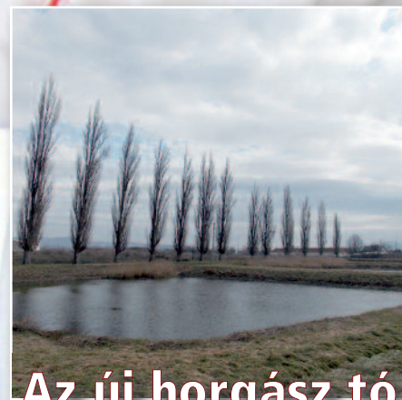
Az új horgász tó tervei