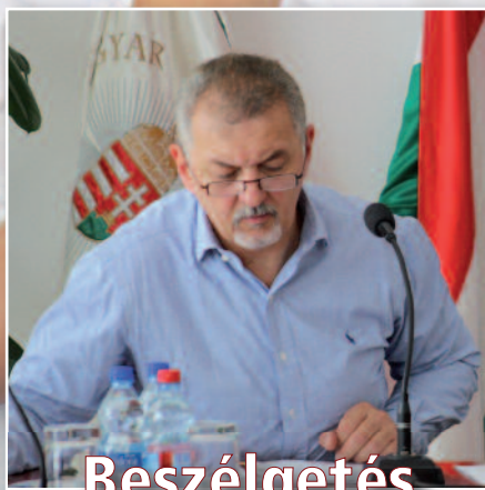
Beszélgetés a polgármesterrel