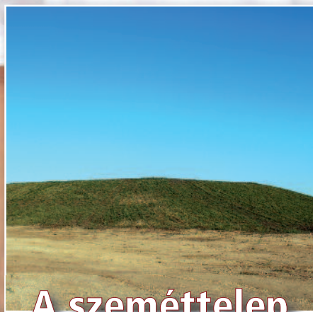
A szeméttelép már a múlté