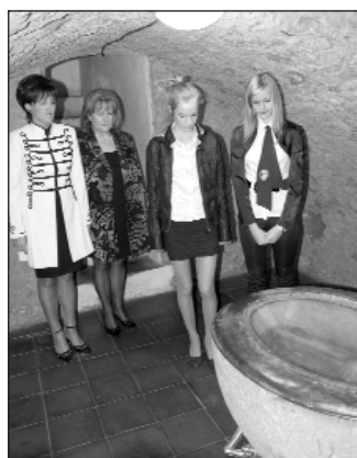
Rákóczi-várként ismert épület.

Rákóczi Zsigmond támogatta a Vizsolyi Biblia megszületését, ezzel a magyar nyelv ismert lett a legszélesebb körökben. Híres adakozásai között említhető, amikor pénzt kölcsönzött a Szepesi Kamarának, aminek ellentéteményeként zálogba kapta meg Szerencs városát, ahol nagy építkezések kezdtek, melynek eredményeként elkészült a ma is