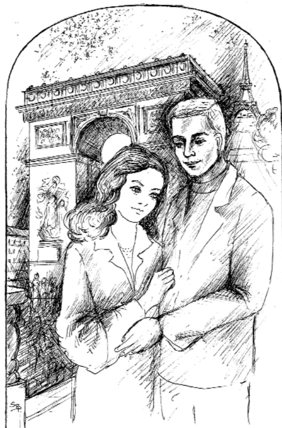
Schlosserné Báthory Pirooska rajza.

Amit a szép ifjúkoron Még egyszer úgy átélhetném Nem ülnék most olyan búsan Az elmúlás nyűtt sekerén