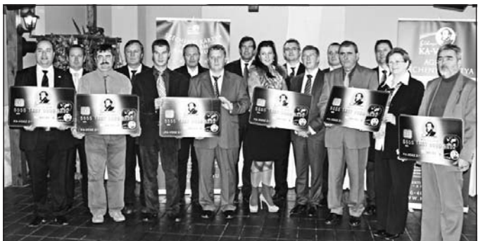
Jubileumi kártyát vettek át a szerencsi ünnepségen.

A 150. ezredik Széchenyi Kártya és az első Agrár Széchenyi Kártya átadása alkalmából szervezett ünnepséget november 14-én Szerencsen a KA-VOSZ Zrt., a Borsod-Abaúj-Zemplén Megyei Kereskedelmi és Iparkamara (BOKIK), valamint a Vállalkozók és Munkáltatók Országos Szövetségének megyei szervezete.