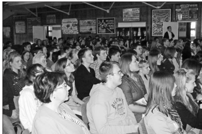
Különleges nyelvi órán vettek részt a gimnázium diákjai.