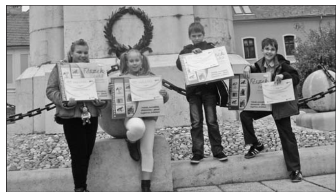
A Rákóczi iskola sikeres csapata.

A háromfordulós megméretésen a Rákóczi Zsigmond Általános Iskola 4. b osztálya vett részt. Először projekttervet készítettek, mely a korosztályukban meghatározott PAKKOlj másként! kódnéven a környezetbarát csomagolásláról, a csomagolóanyagok újrahasznosításának lehetőségeiről szóló cselekvéstervezet megalkotását jelentette. Ezt a világhálón keresztül értékelte egy szakmai zsűri. Második – elődöntő – lépésként a tervet úgymond el kellett adni, vagyis bírák előtt kellett bemutatni október 25-én. Ide már csak a régió legjobb négy csapata kapott meghívást, melyek közül a szerencsi diákok bizonyultak a legjobbnak, ezért hasznos ajándékjutalomban részesültek,