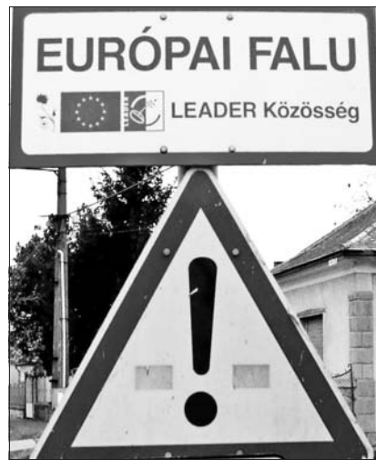
A LEADER célja a vidék összehangolt fejlesztése.

nak. A LEADER elsősorban egy vidékfejlesztési módszer, a helyi igényeken alapuló stratégiaikon keresztül valósul meg helyi szereplők bevonásával. A LEADER nem lehet önmagában fejlesztés, az önkormányzatok, a civil szervezetek és a vállalkozások forráshoz jutt-