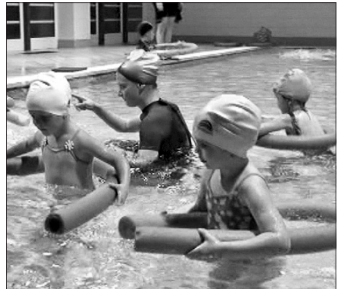
OEP támogatással vehető igénybe az új szolgáltatás.