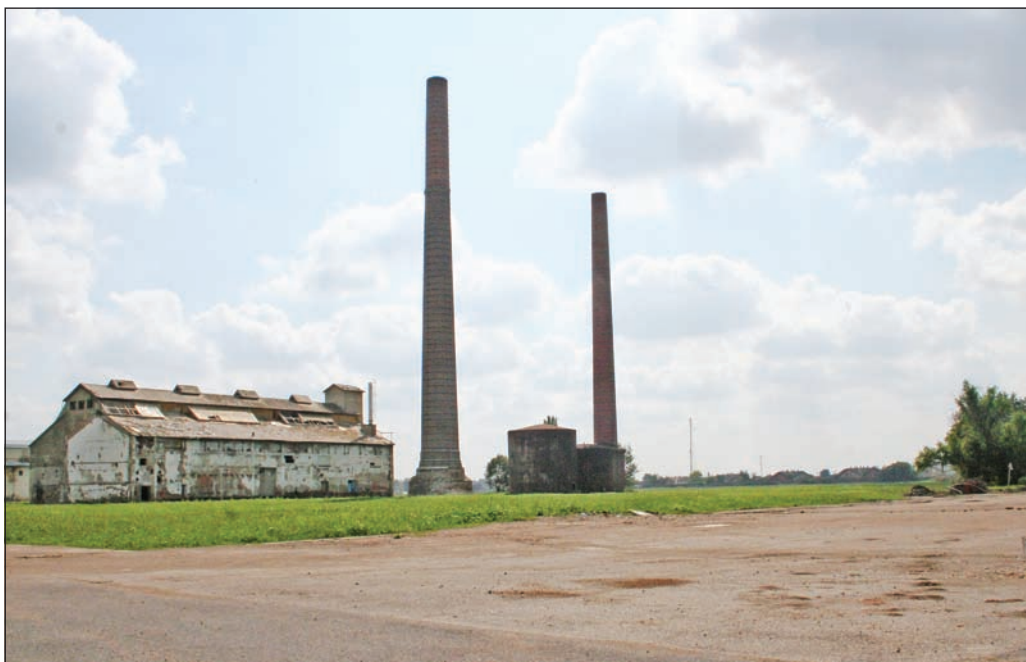
Az ingatlanvásárlás új lehetőségeket hozhat az önkormányzat számára.

Mint arról lapunk előző számában írtunk, Szerencs Város Önkormányzata az október 20-ai ülésén döntött arról, hogy nettó ötmillió forintért megvásárolja a Mátra Cukor Zrt. tulajdonában lévő egykori cukorgyári terület 4,3 hektáros részét, amely tartalmazza a jelenleg műemlékvédelem alatt álló épületeket is.