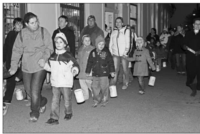
Lámpás felvonulás a város főutcáján.

A Márton-nap a délutáni órákban rendhagyó vásárral folytatódott. Oly sok volt a kirakodni való vásárfia, hogy a Széchenyi utca egy szakaszát le kellett zárni a forgalom elől, mivel a standokat az épület előtti úton helyezték el a szervezők. A hangos zeneszó kísérette vásári forgatagban ki-ki megtalálhatta a kedvére valót. Voltak ott kézműves tárgyak, különféle sütemények, és minden, ami szem-szájnak ingere. Az ovisok és a vendégsereg jó hangulatáról a meglehetősen hűvös időben a Ciráda együttes gondoskodott.