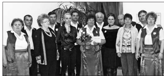
Számos elismerés birtokosai.

Évente hagyományosan vizsztatéró program a Tállyai Nefelejcs Népdalkör Egyesület életében az a találkozó, amelyre baráti népdalköröket, támogatókat, jó barátokat hívnak meg közös éneklésre, kötetlen beszélgetésre.