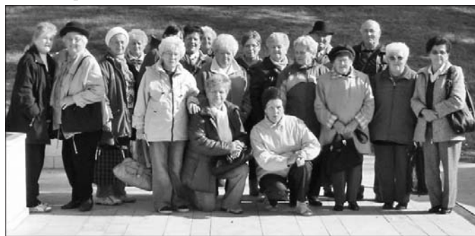
Közös fotó a nyírbátori templom előtt.

A kassai kiállításon jómagam is részt vettem. A vendéglátók nagy szeretettel fogadták csoportunkat. Szép kiállító helyiséget biztosítottak az alkotásoknak. Kedves vendéglátásuknak köszönhetően kellemes napot tölthettünk Kas-