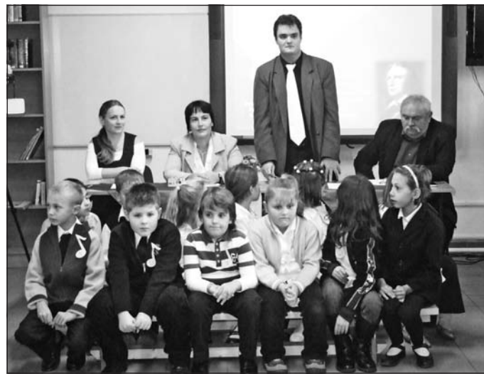
Szerencsi diákok az énekversenyen.