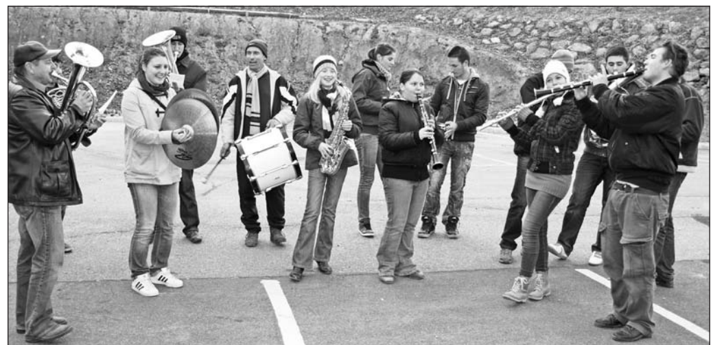
Gyakorlás a friss levegőn.