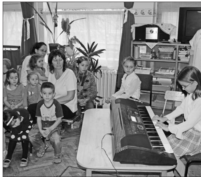
Az óvodások örömmel hallgatták a zenei bemutatót.