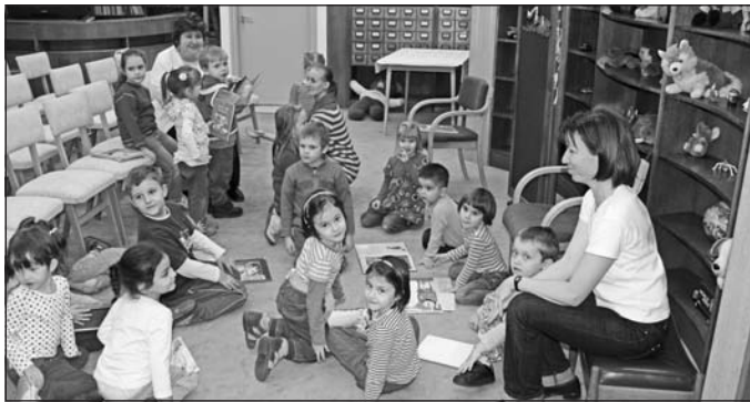
Játék közben ismerkednek az olvasás fontosságával.

A Szerencsi Általános Művelődési Központ könyvtárának munkatársai rendszeresen szerveznek iskolásoknak és óvodásoknak csoportos könyvtárlátogatásokat, emellett játszóházat, mesedélutókat, diafilmvetítéseket, népszokásokhoz, ünnepekhez kapcsolódó foglalkozásokat tartanak. Ebben a tanévben a szerencsi Napsugár óvoda csoportjai látogatnak heti rendszerességgel a gyermekkönyvtárba, hogy megismerkedjenek a létesítménnyel és az olvasás szépségével. A könyvtárosok mesét olvasnak, majd a gyerekek a történetekhez kapcsolódó ki-