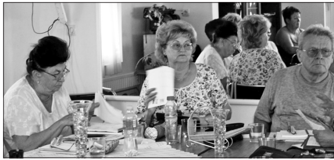
Alkotással és egymás munkáinak megismerésével teltek a napok a nyári találkozón.

ismerkedtek társaik szerzeményeivel, alkotásaival, műhelymunka keretén belül véleményezték azokat, tanácsal látták el egymást. A képzőművészek kiállításán mutatták be a nagyközönségnek az elmúlt egy évben született legjobb alkotásaikat, a tárlat szeptember 10-ig tekinthető meg a helyi „6 Puttonyos Borfalu” kiállítótermében. Az írók, költők meglátogatták a Bodrogkeresztúri Idősek Otthonának lakóit is, műsorral kedveskedtek nekik, színesítve a hétköznapok egyhangúságát. A Leskó Imre által vezetett tartalmas