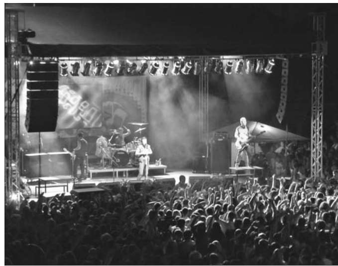
A Hooligans együttes koncertjére több ezren voltak kíváncsiak.