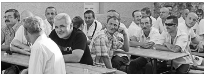
A fesztivál sikeres rendezésében részt vállaló valamennyi dolgozónak köszönetet mondtak a szervezők.

Az augusztus 31-ei est költségeit a szervezők felajánlásokból biztosították. H. R.