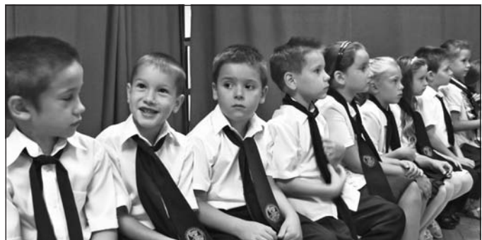
Az első osztályosok beléptek a betűk és a számok birodalmába.

Két első osztály, összesen hatvan kisdíák foglalta el helyét szeptember 1-jén a Rákóczi iskola ünnepélyes tanévnyitóján.