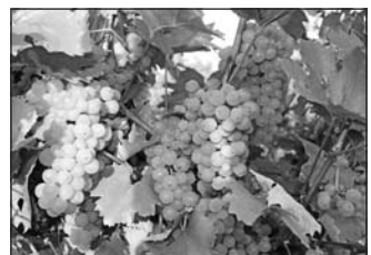
Az idén korán beérett a termés.

A szőlő érettségi állapota korai szüretet ígér a Tokaji borvidéken. Az idén betegség nem tizedeli a termést, a fűrtök egészségesek és úgy tűnik, felvásárlóból sem lesz hiány.