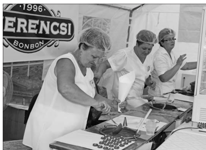
Látványlátásban készültek a kézi desszertek.

ország legnagyobb, 100 kilogramm grillázs felhasználásával készített épülmakettjét, amely a szerencsi Rákóczi-várat ábrázolja.