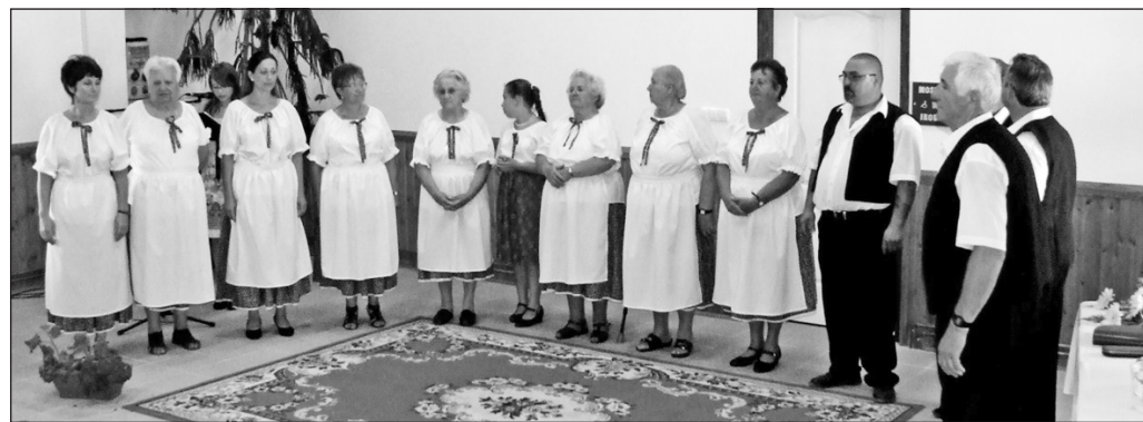
A 25 esztendő kórus.

Nem mindennapos ünnepet tartott augusztus 27-én a Tállyai Kóvirág Népdalkör Egyesület. A civil szervezet negyedszázados születésnapra invitált barátokat, ismerősöket, magyar népdalokat gyűjtő és előadó csoportokat.