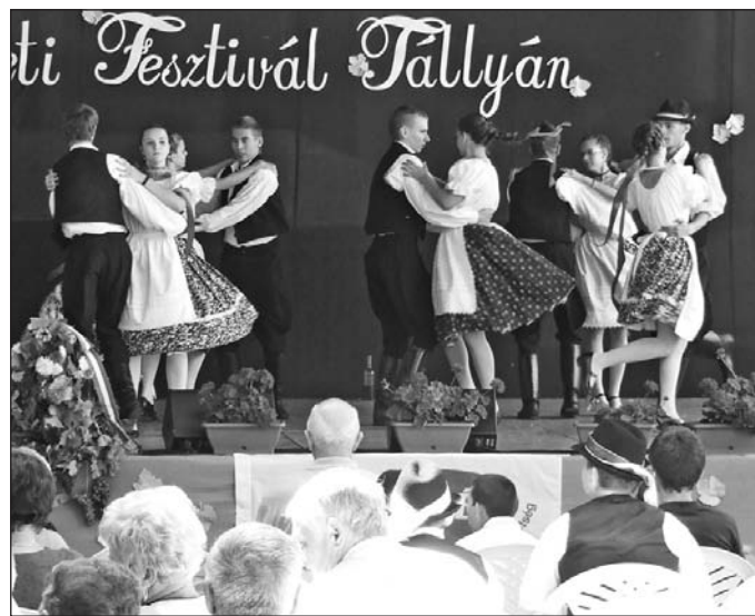
A szerencsi Bocskai Gimnázium táncosai is felléptek a kulturális programban.