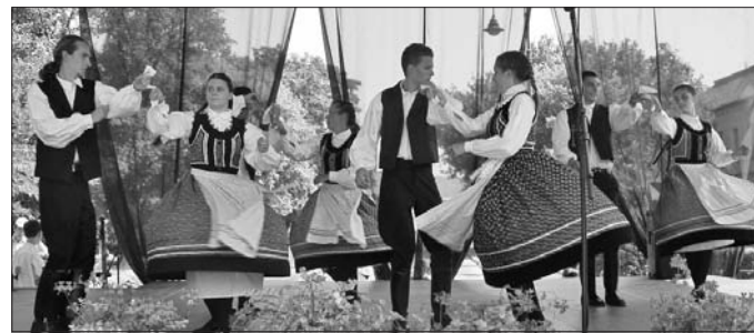
A Hajnali Néptánc Együttes fellépései sikert aratnak.

raban próbálunk, hogy minden a legtökéletesebben menjen. Nagyon jó hangulatban telnek a foglalkozások, ehhez persze arra is szükség van, hogy mindenki teljes erőbedobással dolgozzon. Célu tűztük ki, hogy táncainkkal továbbra is színesítsük Szerencs életét. Szeretnénk, ha testvérvárosaink is megismernék egyesületünkön keresztül vidékünk tánc-kultúráját. Együttal csoportunk is nyitott új koreográfiák megismerésére, tájegységek táncainak elsajátítására. Ezen az úton már elindultunk: egy éve Szatmárnémetiben szerepeltünk a szüreti fesztiválon. Akik kedvet és elhivatottságot éreznek a magyar népi kultúra iránt – emelte ki a táncnár – bátran csatlakozzanak egyesületünkhöz.