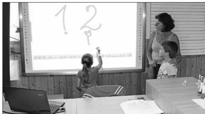
Új interaktív táblák segítik az oktatást.

Az elnyert 52 millió forintból a Rákóczi iskolába 20,5 millió forint, a Bolyai iskolába 17 millió forint, a Bocskai gimnáziumba pedig 10 millió forint értékben kerültek többek között új számítógépek, laptopok, interaktív táblák, továbbá biztosított a vezeték nélküli internet-elérés is. Az új technika a sajátos nevelési igényű fiataloknak is lehetőséget biztosít a számítástechnikai eszközök használatára. A beszerzett PC-kből a Bolyai is-