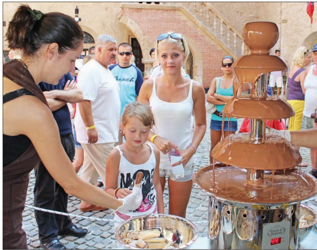
A fesztivál egyik kedvelt látványossága a csokiszökőkút volt.

Népdalkörök, fúvószenekar, hagyományörző csoportok követték egymást a fesztivál színpadain, miközben sorra léptek fel a helyben élő fiatal tehetségek. Szinte megszámlálhatatlan az egymást követő programok sora, amely négy napon át szórakoztatta a publikumot. A színpadi bemutatkozások mellett pedig hatalmas sikert aratott a csokoládé-kalandpark, ahol nemcsak az édes masszából lehetett képeket festeni, de volt itt lovagi torna, íjászat, célba lö-