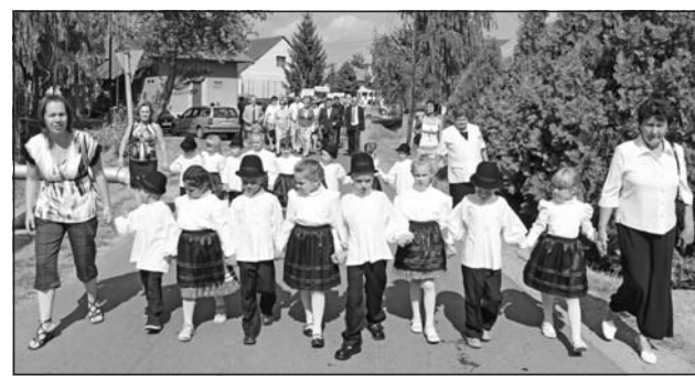
A rátkai óvodások sváb népviseletben vonultak fel.

Tizennyolcadik alkalommal rendezte meg Rátka önkormányzata azt a nemzetiségi fesztivált, amelyre szeptember 3-án mintegy háromszáz vendég érkezett a zempléni településre.