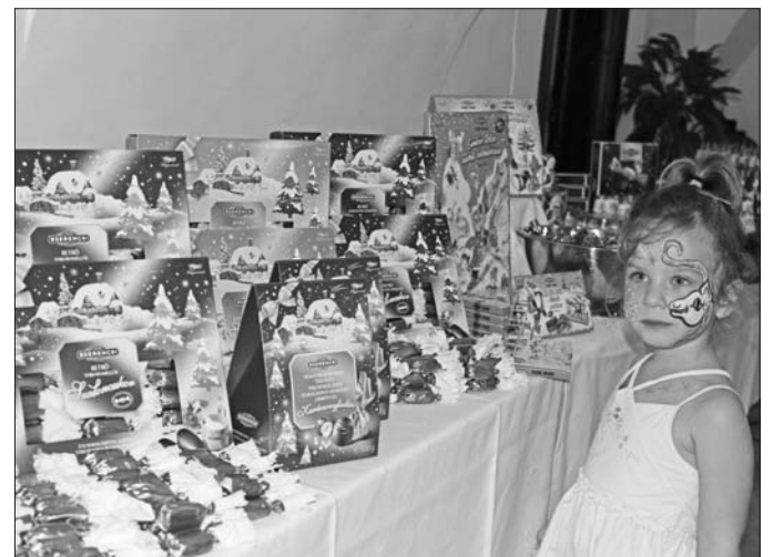
A Szerencsi Bonbon Kft. kiállított termékei már a téli ünnepeket idézték.