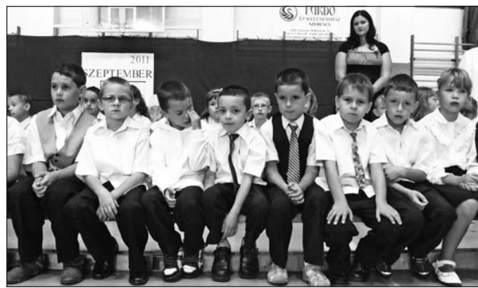
Az iskola legifjabb diákjai.