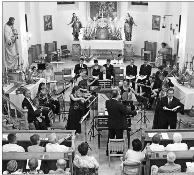
A Purcell Kórus és az Orfeo Kamarazenekar barokk zenei darabokat adott elő.