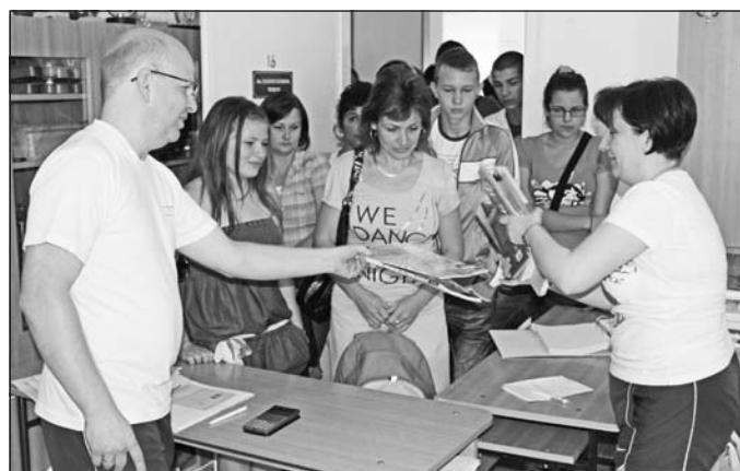
Három napon át tartott a könyvvásár a szerencsi gimnáziumban.

Várhatóan idén is ezer körül lesz azoknak a tanulóknak a száma, akik a szerencsi Bocskai István Gimnáziumban kezdik meg a 2011/2012-es tanévet. A diákok és szüleik az augusztus 15-ei héten vásárolhatták meg az új oktatási esztendőre szóló könyveiket.