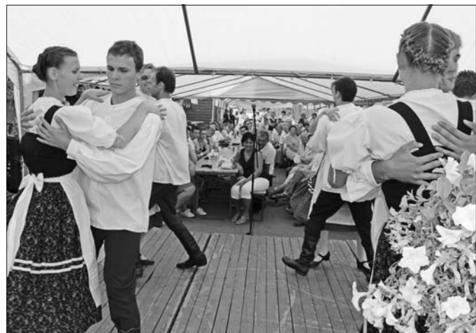
A rátkai táncosok parádés műsort adtak.