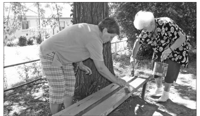
A játékszerek karbantartását a Nyárutó Klub vállalta magára.

A szerencsi Nyárutó Klub az elmúlt években „örökbe fogadta” az Ondi úton található játszótér. A nyugdíjasok fontosnak tartják a terület rendezettségének megőrzését, ezért minden esztendőben önkéntes akciót szerveznek, annak érdekében, hogy kulturált, tiszta környezetet fogadják az ide érkező gyermekeket.