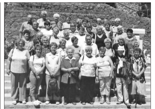
ket. Kellemesen elfáradva, de élményekben gazdagabban tértük kora este haza.