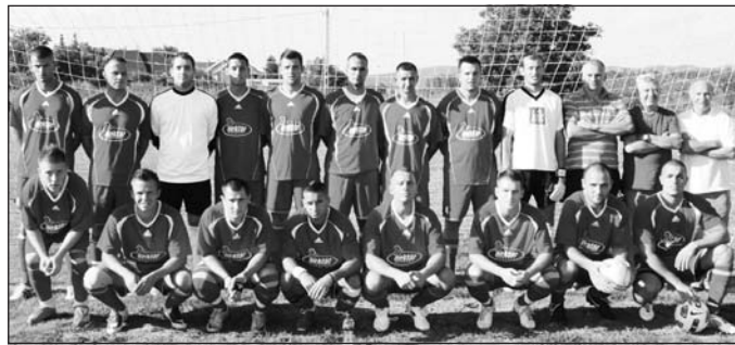
Biztos hazai győzelemmel kezdte az idényt a város felnőtt futballcsapata.