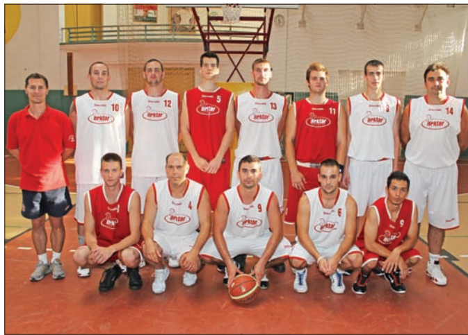
Az ország élmezőnyéhez tartozik a szerencsi csapat.

– A rájátszás ugyan nem úgy sikerült, ahogy szeretnénk volna, így első körben nem teljesült régi álmunk, a feljebb ju-