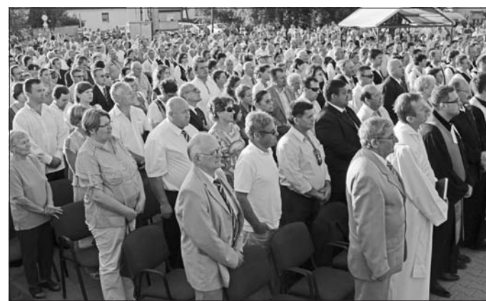
Az állampolgársági eskütétel résztvevői és az ünnepség vendégei benépesítették Abaujszántó díszterét.