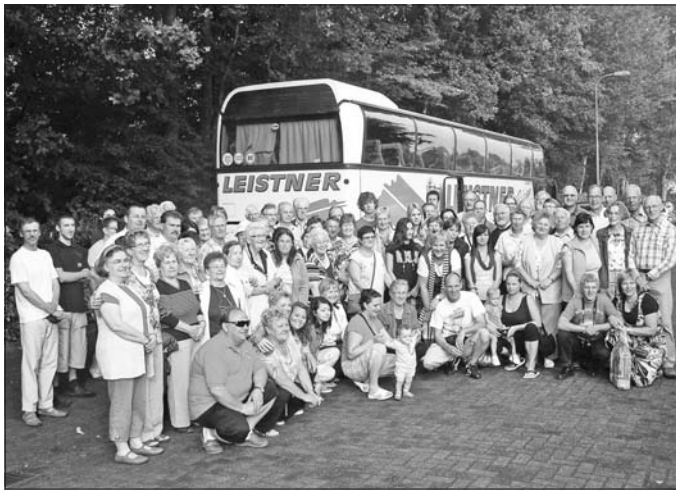
Emlékező utazáson vettek részt a szerencsi reformátusok.

A múlt év szeptemberében a 30. évfordulójára emlékezünk annak a kapcsolatnak, amely Szerencs és a hollandiai Joure református gyülekezetei között kialakult. Az első találkozás 1980 áprilisában, a szerencsi országgyűlés 375. évfordulóján történt, amikor egy nyolctagú delegációt küldtünk a szerencsi templomunkban az észak-hollandiai fríz városkából. A tavalyi látogatás vizsgálatára július 28-án egy 46 tagú gyülekezeti csoport kelt útra, hogy öt napot töltsön a csoport fele számára már ismert családok vendégszeretében (a többi résztvevő ez alkalommal utazott először Hollandiába). Sok kedves élményben volt részünk a néhány nap alatt. Vasárnap délelőtt és délután istentiszteletet és zenedélutánon voltunk együtt vendéglátóinkkal, ahol mindkét gyülekezet kórusa énekelt. Megtekintettük a híres, 32 km hosszú zárógátat, amely még a világháború előtt készült, a '30-as évek válsága idején munkát adva sok száz embernek. Ez az építmény védi a tenger be-