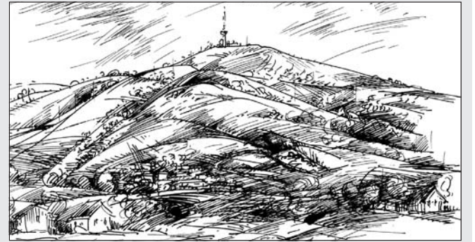
Schlosserné Báthory Piroksa: Hegyalja

3900 Szerencs, Rákóczi-vár. Postacím: 3900 Szerencs, Magyar u. 74. Adószám: 18419991-1-05 Számilaszám: Tokaj és Vidéke Takarékszövetkezet 56100048-11033358 (3525 Miskolc, Bajcsy-Zsilinszky út 18.)