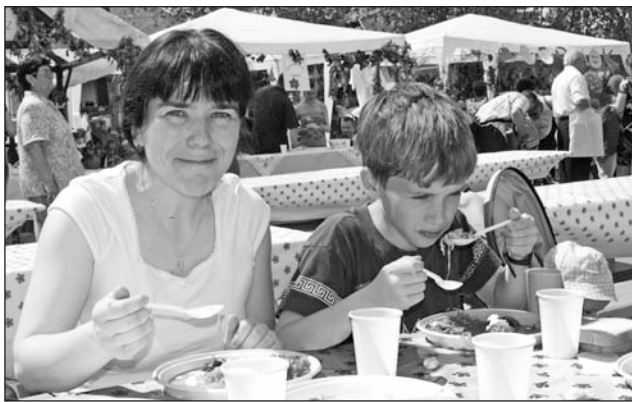
A vendégek szívesen kóstolták az ízletes falatokat.

„Ki lehet bírni, ha rossz ételeket főznek, de azt nehezen, ha jó ételeket készítenek rosszul” – tartja a mondás. Bár a szlogen igaz, tartalmát tekintve nem sok keresni valója volt Rátkán, mert hogy az első alkalommal megrendezett Töltött Káposzta Fesztiválon csak jól elkészített ételeket talált a zsűri.