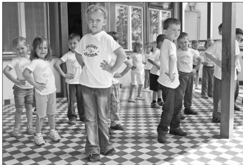
A gyerekek közös tornával kezdték a Kihívás napját.

Óvodánkban május 19-én programot szerveztünk a Kihívás napja alkalmából, melyen 43 gyerek és 5 felnőtt vett részt. Reggel kiosztottuk a csöppsegeknek a „Csalogány óvoda” feliratú pólót, amit örömmel vettek fel. Bemelegítésként a kicsik a csoportszobában szökdeltek, helyben futottak. Különböző gimnasztikai gyakorlatok következtek: volt fekvőtámasz- és guggolóverseny. A Paiff, a bűvös sárkány című zenére együtt tornáztak a gyerekek és a felnőttek. Ezután sorversenyeket szer-