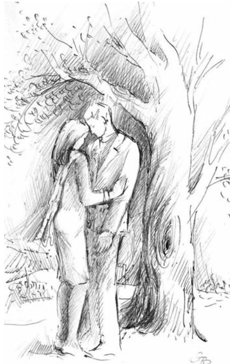
Schlosserné Báthory Piroska: Búcsú

Testünkre borítjuk a krisztusi vásznat, (hogy el ne vesszünk). Kihagyó szívem nászágyunkból Csókot dob a halálnak.