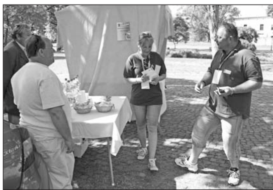
A túra szerencsi állomása a várkertben volt.

A B.-A.-Z. Megyei Önkormányzat 2010 tavaszán rendezte meg először a Rákóczi Autós Pálinkatúrát, amelynek fő célja – megyénk propagálása mellett – a hungarikumként is jegyzett pálinka népszerűsítése volt mind a versenyzők, mind az érdeklődő népes közönség körében. A tavalyi túrán 22 autós állt rajthoz és megadott útvonalon haladva több mint 350 km-es távot teljesítettek.