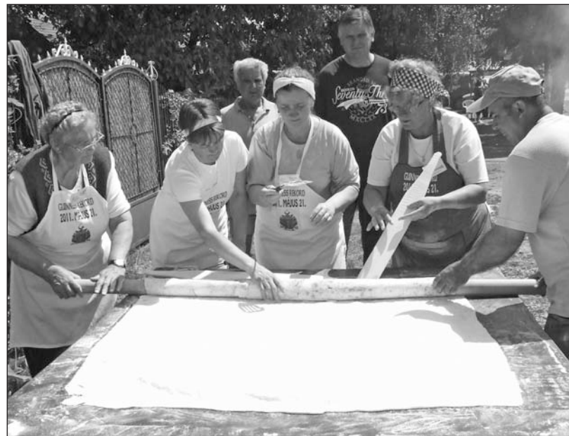
Rekord méretű lángost sütöttek Abaújszántón.