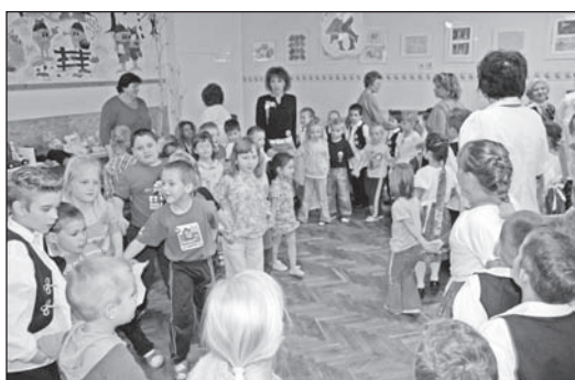
A Gyárkerti óvodában komoly figyelmet fordítanak a gyerekek fejlesztésére.

A helyi nevelési program célkitűzései alapján minden gyermek külön figyelmet kap, folyamatosan nyomon követjük fejlődését. Célunk a kis emberkének optimális fejlesztése. Figyelembe kell