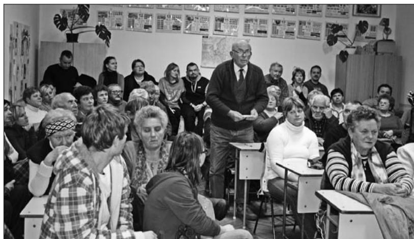
Az ondiak több, a települést érintő kérdést tettek fel.

kében. Panaszként fogalmazódott meg, hogy a főutca burkolatának a felújításakor az út szélén a vízelvezetést biztosító sávra már nem került aszfalt. Volt, aki azt nehezményezte, hogy a kukák ürítése után akkor is fizetni kell, ha az ingatlan tulajdonosok ki se tették a lakás elő a gyűjtőedényt. Kérésként fogalmazódott meg, hogy a Hunyadi és Ady Endre utcákban fekvőrendőrökkel lassítsák a horgászto miatt megnövekedett forgalmat. A református templomnál pedig építsen járdát a város és ide is kerüljön a településrészen elhelyezett virágládából. Az ondi közmeghallgatás is szóba került a közbiztonság, aminek a hiányosságai elsősorban a hétfégen szórakozni vágyó ifjúságot érintik. Mint válaszként elhangzott, Szerencsen biztonságban élnek az emberek, a rendőrség pedig jelentős erőfeszítéseket tesz a környező településekről a városba érkező, nem megfelelően viselkedő fiatalok megfékezésére. Ebben a munkában az elmúlt időszakban már jelentős eredményt ért el a hatóság.