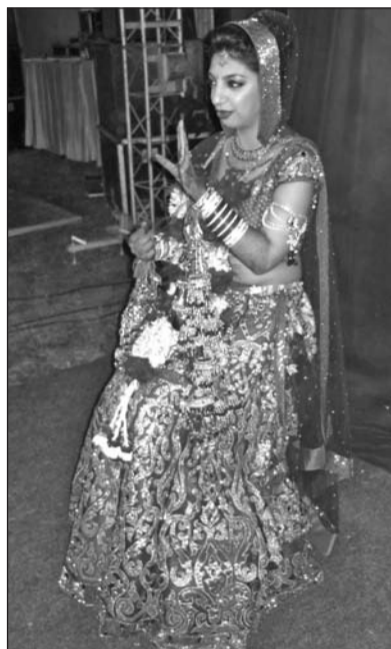
Az indiai menyasszony.

lönöző nyelvet és körülbelül 844 dialektust ismert el az indiai állam 2007-ben. A hindu, keresztény és muzulmán vallások tökéletesen megférnek egymás mellett: a lakosok nem csak arra ügyelnek, hogy a másik vallást ne sértsék meg, hanem hogy a sajátjukat is megőrizze. Kitűnő példa erre az Agrában található Taj Mahal, melyben három építészeti stílus, a perzsa, iszlám és indiai ötvöződnék. Építője, Shah Jahan mogul uralkodó a sírhelyet harmadik és egyben kedvenc felesége emlékére emeltette, aki tragikus módon, 14. gyermekük születése közben halt meg.