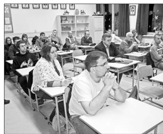
A szakosztályok vezetői titkos szavazással választották új tisztségviselőket.

Tisztújítás volt a városi sportegyesületnél. A civil szervezet november 22-ei küldöttközgyűlésén a szakosztályok képviselői titkos szavazással döntöttek az elnök és az ügyvezető személyéről, megválasztották az elnökség és az ellenőrző bizottság tagjait.