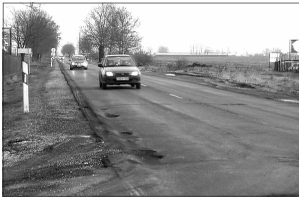
A főútvonal ugyancsak megérett már a felújításra.

Az elmúlt években a felszólalói körforgótól Gesztelyig tartó szakasz négy-sávosításával ugyan javultak a közlekedési feltételek Szerencs és Miskolc között, de a főút beruházásban nem érintett szakaszain helyenként komoly balesetveszélyt jelentenek a burkolati hibák. A téli időszakban az elhasznált aszfalt kátyúk sokasága nehezíti a közlekedést, amelyek befoltozása csak ideiglenes megoldást jelent a közlekedőknek. Ennek a bal-