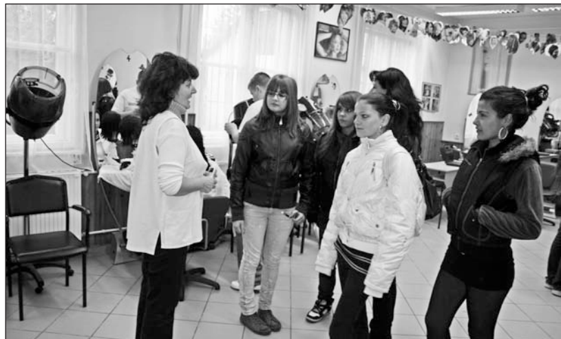
A fodrász pálya iránt jelentős az érdeklődés.

Pályaválasztási nyílt napot tartottak november 24-én a Szerencsi Szakképző Iskolában. Az évente ismétlődő ese-