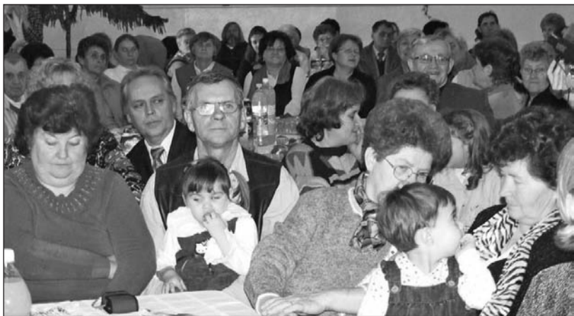
Nagymamák és nagypapák az unokáikkal.