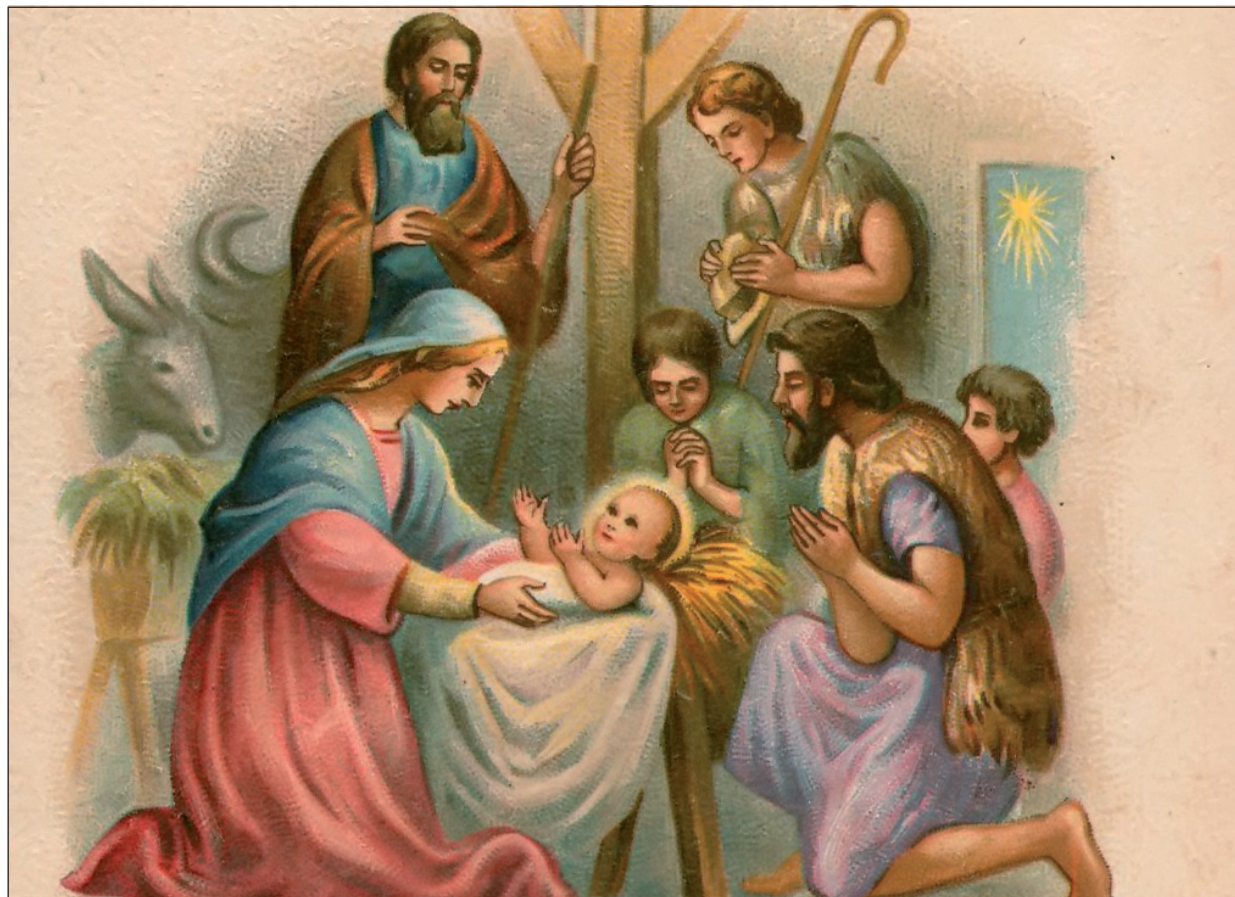
Képeslap a Zempléni Múzeum gyűjteményéből.

Sok fiatal indul el a nagy városokból, a fővárosból vagy esetleg messzebbi országokból, az ünnep napjai előtt hazafelé, hogy szülőikkel, nagyszülőikkel együtt tölthesse az ünnepet. Nagy várakozással készülnek itthon is a hazaérkezés napjára. Örömmel látjuk az ünnepi istentiszteleten is, hogy hazajöttek távolról is az ifjak, és együtt lehetünk azokkal, akiket az év során talán csak most látunk itthon, és együtt állhatunk az Úr asztalához. Nem szeretném lebecsülni a szülőföld vonzását, a család közössége utáni vágyat, hiszen ez dobogtatja meg a szíveket a távolban is, ez indít el hosszú, olykor fáradtságos utazásra, mégis úgy érzem, hogy valami mélyebb érzést szólaltat meg a költő versében. Nem pusztán a múlt emlékei, egy korábbi kedves hely iránti vágyakozásnak ad hangot, nem valami egyszerű nosztalgia szavait írja le, hanem a lelke mélyéről sóhajt fel.