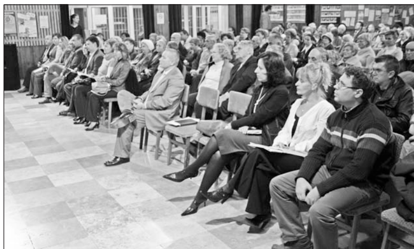
A szerencsi eseményt a Bocskai gimnáziumban tartották.

személyautóból álló gépjárműpark, esetenként kiemelkedően magas bérek jelentettek terhet az önkormányzat számára.