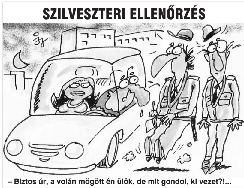
– Biztos úr, a volán mögött én ülök, de mit gondol, ki vezet?!...