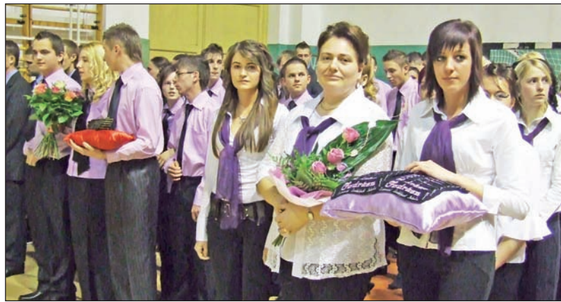
Öt végzős osztály sorakozott fel az ünnepi alkalomra.