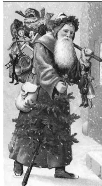
Képeslap a Zempléni Múzeum gyűjteményéből.