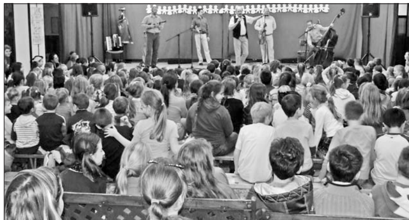
Színpadon a Kolompos együttes.

Zenés mulatságra várta az érdeklődőket november 24-én az általános iskola Rákóczi épületének aulájába a Kolompos együttes. A budapesti zenekar neve nem ismeretlen a városban, hiszen már évek óta Szerencsen rendezik meg nyári táborukat, amelyre az ország különböző térségeiből és a határon túlról is érkeznek