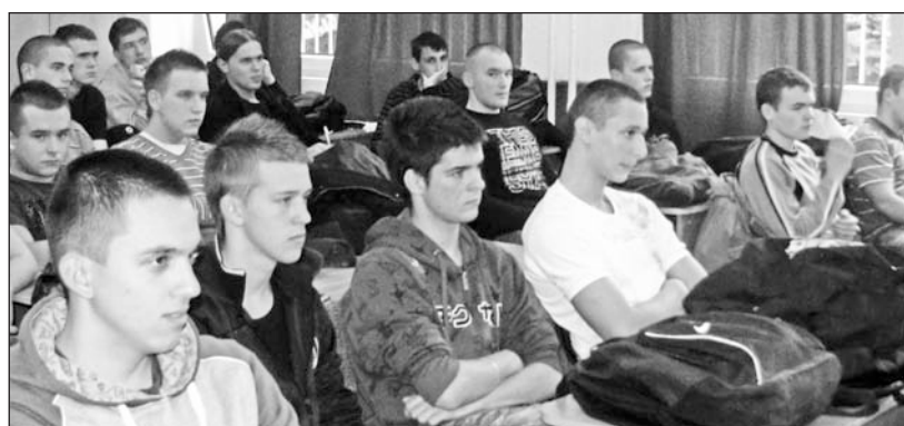
A Bocskai gimnázium rendészeti tagozatos diákjai tájékoztak a katonai pályáról.

felelniük azoknak, akik ebbe az irányban kívánnak továbbtanulni. A Zrínyi Miklós Nemzetvédelmi Egyetemre például csak azok kerülhetnek be, akik a kitűnő tanulmányi eredmény mellett kellő állóképességgel rendelkeznek, és az orvosi, valamint a pszichológiai vizsgálatokon is megfelelnek a szigorú követelményeknek.