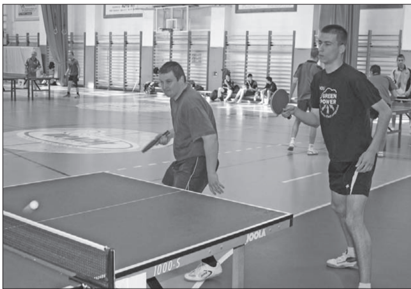
Mindkét szerencsi pingpongcsapat jól teljesít a bajnokságokban.