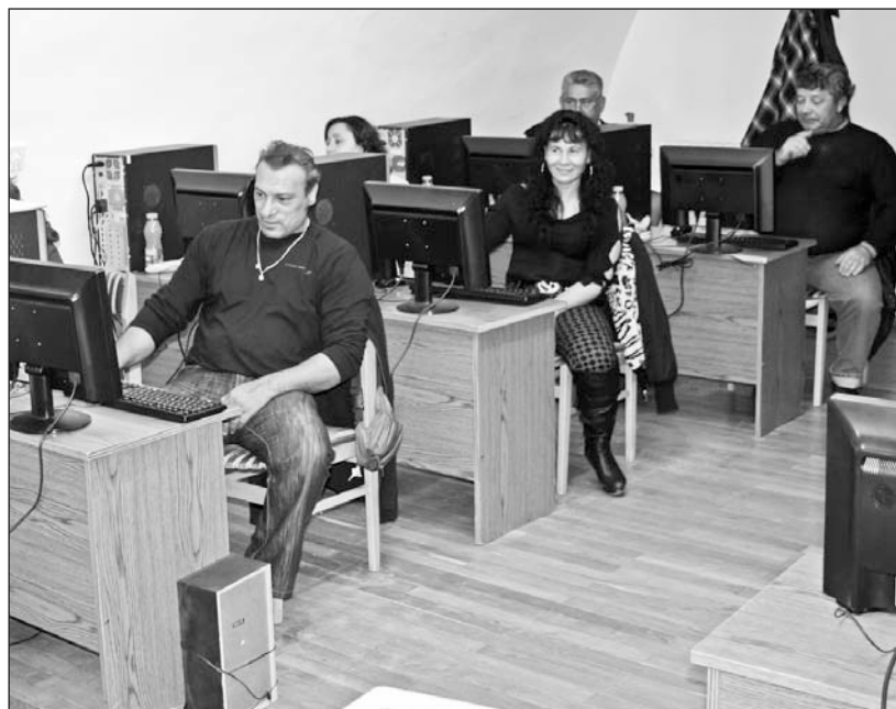
Ismerkedés a számítógéppel.

Száz hátrányos helyzetű ember szerzett informatikai alapismereteket szeptember 20-a és november 26-a között a Városi Kulturális Központ és Könyvtárban. A program költségeit a Társadalmi Megújulás Operatív Program által biztosított támogatás fedezte.