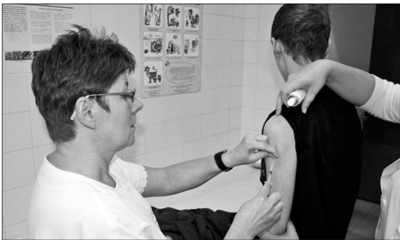
A Szerencsi Általános Iskola Bolyai épületében már megkezdődött az oltás.

A kormány döntése után a szakminisztérium oltópontokat hozott létre az ország különböző térségeiben. No-