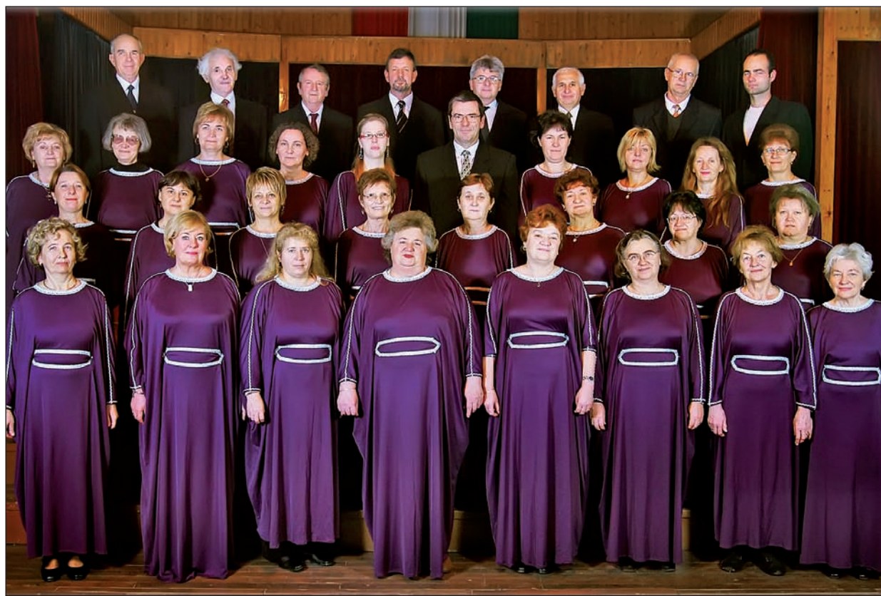
A kórus igazi közösséget alkot.

Fennállásának negyvenedik évfordulóját ünnepelte november 21-én a Hegyalja Pedagógus Kórus. A Rákóczi-várban megtartott koncerten a közönség mellett négy vendég énekkar osztozott a jubiláló örömeiben.