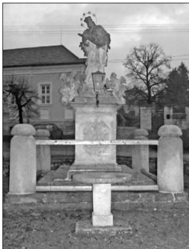
Több mint kétszáz éve díszíti a község közterületét Nepomuki Szent János szobra.