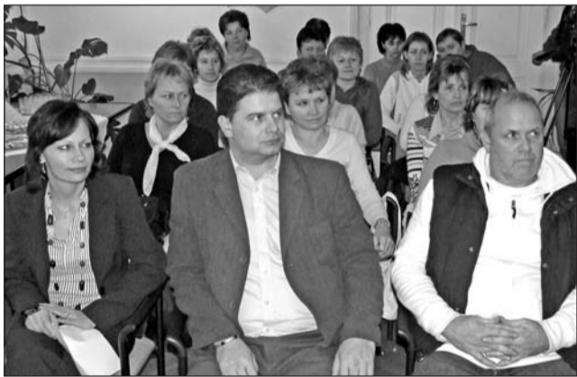
Áldozatos munkával nyújtanak segítséget a rákosulóknak.