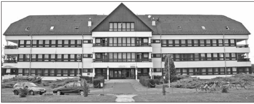
Közel nyolcszázmillió forint fejlesztés valósul meg az egészségügyi intézményben.

Sorozatunkban azokat a beruházásokat mutatjuk be, amelyet az elkövetkező időszakban jelentős pályázati támogatás felhasználásával valósít meg az önkormányzat Szerencsen.