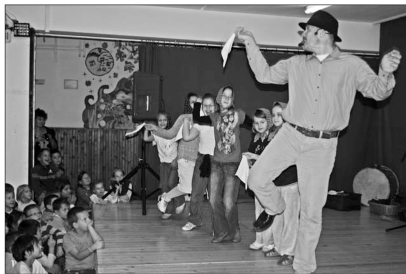
A Kolompos együttes műsora magával ragadta a gyerekeket.

sék meg a fiatalokat. A műsor egyik fordulópontja volt, amikor színpadra szólították a szerencsi kanászlegényeket, akik a csárdás hallatán