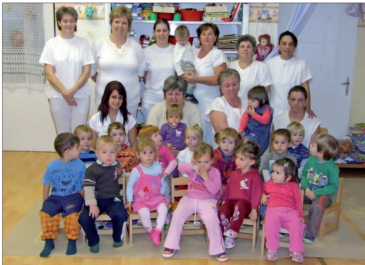
A szerencsi bölcsőde ifjú lakói és gondozói.

Harminc éve működik a városi bölcsőde Szerencsen. A jubileum alkalmából tartottak ünnepséget október 15-én az intézményben, ahol az évfordulón új csoportszobát is avattak.