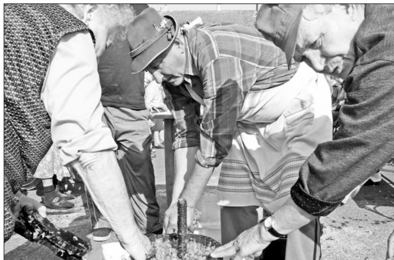
Felelevenedtek a szüreti szokások.

Másnap Ondon tartottak idősnapi mulatságot. A résztvevők a helyi idősök klubja épületében vidám beszélgetéssel töltötték az időt. A jó zene hallatán néhányan táncrea is perdültek. Az udvaron felállított üstben hamarosan elkészült a finom ebéd is, majd vidám hangulatban ülték körbe a hosszú, megterített asztalt a meghívtak.