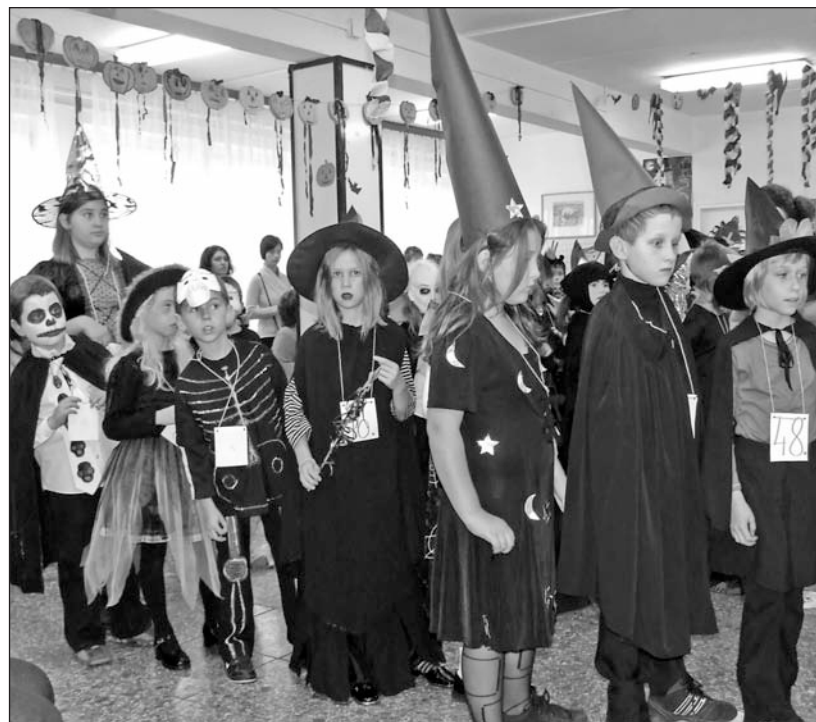
Jelmezes fiatalok mutatkoztak be a zsűri előtt.