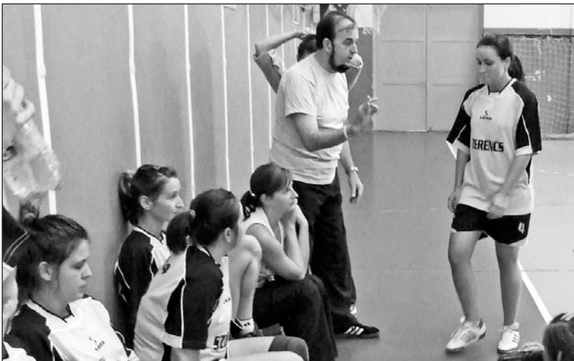
Az edzői tanácsokat megfogadva győzött a csapat.