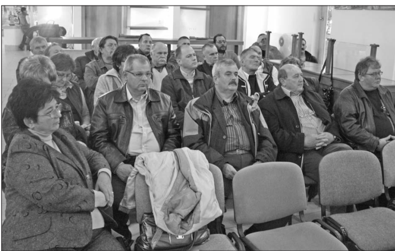
A helyi vállalkozók a világörökségi kapuzatban tájékoztatták a támogatási lehetőségekről.

A világörökségi kapuzat fogadóépületében rendezte meg soron következő összejövetelét a Szerencsi Vállalkozói Klub Egyesület. Az október 16-ai szakmai programon a Gazdaságfejlesztési Operatív Program és az Országos Foglalkoztatási Közalapítvány eszközbeszerzésre, foglal-