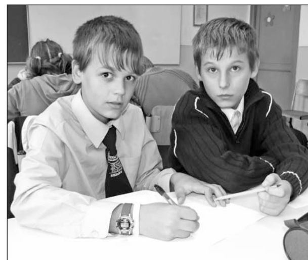
Szerencsen több mint százötven diák töltötte ki a feladatlapot.

lás, valamint a hatosztályos képzés első két évfolyamára járó gimnazista jelentkezett a feladatlapok kitöltésére. A tizenhárom kérdéses teszt mellett a megoldás részletezését igénylő szöveges példa is a próbatételek között szerepelt. A négyfős csapatok közül a legjobbak kerülnek a november 21-ei országos döntőbe.