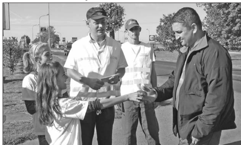
A szabályosan közlekedőknek alma volt a jutalmuk.

A program keretében október 5-én délelőtt a 37-es számú főút szerencsi átkelési szakaszán tartottak közúti ellenőrzést a rendőrök, akikhez a Szerencsi Általános Iskola diákjai csatlakoztak. Munkába állt a sebességmérő, de ez alkalommal szerencséje volt azoknak a járművezetőknek, akik vétettek a KRESZ előírásaival szemben. A kisebb szabálytalanságot elkövetőknek ezúttal nem pénzbüntetés, hanem déligyümölcs volt a jutalmuk. A bő egy óra alatt sokkal több almát osztottak ki a diákok a szabályosan közlekedőknek, mint ahány citrom talált gazdára. A déligyümölcsöt ál-