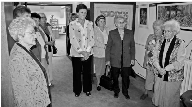
Féltve őrzött gyűjtemények darabjai kerültek a paravánokra a „Kreatív nagyik” című kiállításon.