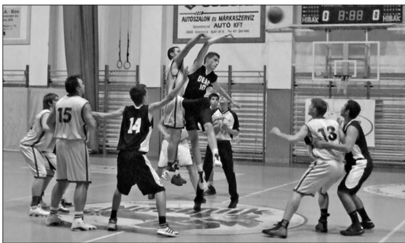
A fiatal debreceniek ellen a szerencsi csapat rutinja kellett a sikerhez.

Szinte tapintható volt a feszültség a küzdőtérén, ahol ez alkalommal a rutin és a gyorsaság állt szemben egy-