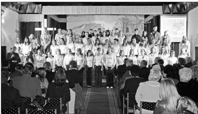
A Bocskai gimnázium diákjai elevenítették fel az 53 évvel ezelőtti eseményeket.