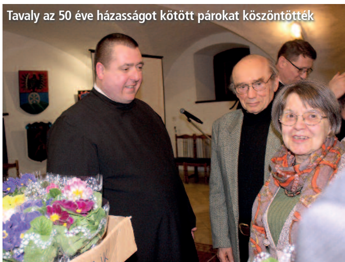
Tavaly az 50 éve házasságot kötött párokat köszöntötték