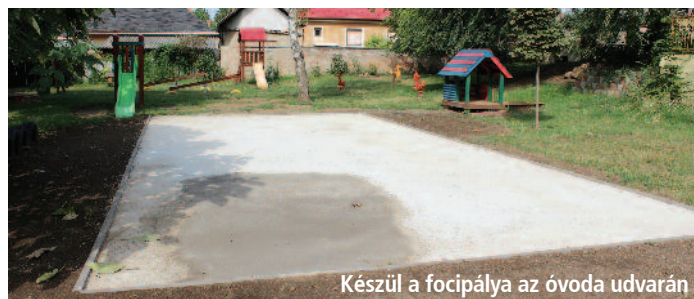
Készül a focipálya az óvoda udvarán

Minden évben arra törekszünk, hogy az épületek esztétikusak, higiénikusak legyenek és küllemben is egy új formával gazdagodjunk. Próbálunk mindent megtenni annak érdekében, hogy elnyerjük a gyerekek tetszését. Ezeken a tisztasági festéseken, meszeléseken, karbantartásokon kívül