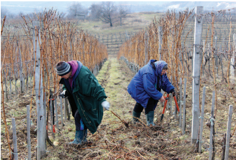
Megkezdődtek a tavaszi metszések

A kora tavaszi fagy jelentős károkat okozhat a szőlőnek rügyfakadás idején, ami körülbelül 10 és 13 fok között indul meg. Ebben az időben, ha a hőmérséklet újra fagypont alá csökken, elfagyhatnak a rügyek s így kevesebb lesz a termés is. A gazdáknak már a szőlő ültetésekor megannyi időjárási viszonyra és területi adottságra oda kell figyelniük, hiszen ha nem megfelelően választják ki a földet, egy nem várt fagy a szőlőültetvényben jelentős termés kiesést okozhat. A kevesebb szőlő kevesebb bort is eredményez, ami drágulást is előidézhet a piacon. Az elmúlt hónapok meglehetősen hideg időjárása miatt az ország területén átlagosan a rügyek csaknem a 20-30 százaléka fagyott meg. Szerkesztőségünk kíváncsi volt arra, mi a helyzet a környéken. A visszajelzések azonban azt mutatják, hogy a helyi borászok bizakodhatnak. A Tokaj-Hegyaljai borvidéken átlagosan most mindössze csak 10 százalékos a fagykár –