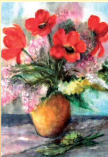
Schlosserné Báthory Piroska: Csendélet Nőnapra