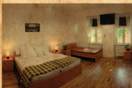
SZÉP kártya elfogadóhely

Az akció más kedvezménnyel nem vonható össze. Az ajánlat előzetes időpont-egyeztetés és szabad kapacitás függvényében vehető igénybe. Az ár- és programváltoztatás jogát fenntartjuk.