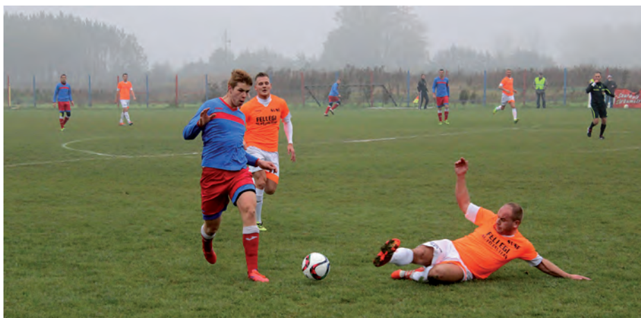
A Tatay Zoltán Ifjúsági Sporttelepen lévő labdarúgópálya fejlesztésére is szükség lesz a jövőben.