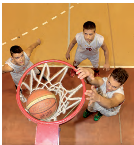
A kosárlabda az egyik legtöbb fiatalot vonzó utánpótlás szakosztály.