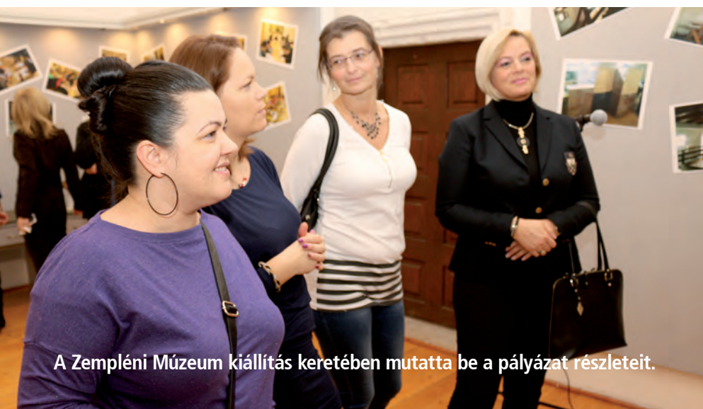
A Zempléni Múzeum kiállítás keretében mutatta be a pályázat részleteit.