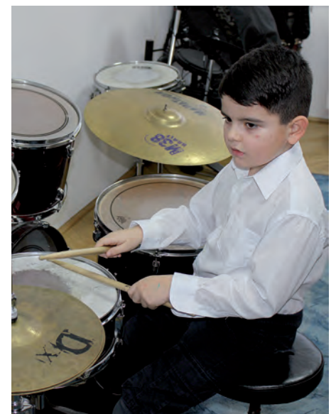
A zenei képzésekre idén több mint 260 tanuló iratkozott be.