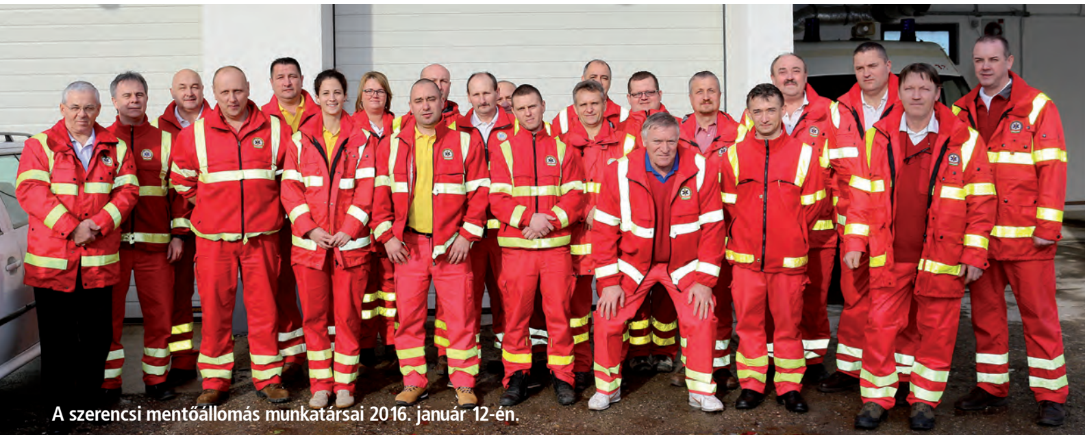
A szerencsi mentőállomás munkatársai 2016. január 12-én.