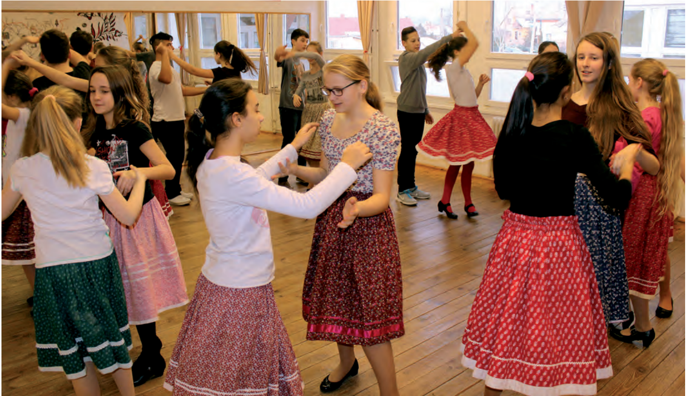
Az egyik legnépszerűbb tanzsok, a néptánc.

Lezárult az első félév a Rákóczi Zsigmond Református Általános iskola művészeti képzésén. A növendékek gyakorlati bemutatók keretében adtak számot tanulóikról, az elmúlt időszakban szerzett ismereteikről. A zene, tánc, képzőművészet és színjátszás tanzsok diákjai a két hetes időszakot jó eredménnyel zárták, mindenki teljesítette a pedagógusok által előírt követelményeket.