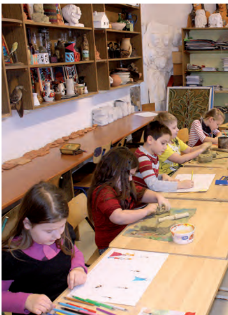
A képzőművész-növendékek vizsgamunkáival zárják a félévet.

A művészeti képzés hallgatói számára most kezdődik az igazi megmérettetések időszaka. A félévi beszámolók után a különböző versenyekre, fesztiválokra készülnek a diákok.