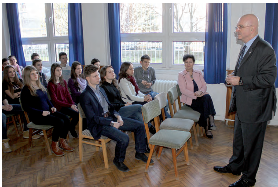
Ilan Mor angol nyelven tartott előadást.

Ilan Mor, Izrael budapesti nagykövete tartott előadást 2016. január 14-én a szerencsi Bocskai István Katolikus Gimnáziumban. Az angol nyelvű prezentációban a diplomata beszélt hazája kialakulásáról, vallási, etnikai, kulturális sokszínűségéről és a szellemi tőke fontosságáról az ország fejlődésében. A nagykövet kiemelte,