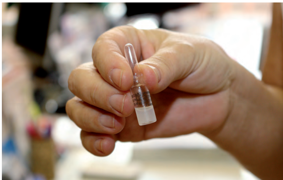
Minden háziorvosnál rendelkezésre áll a vakcina.