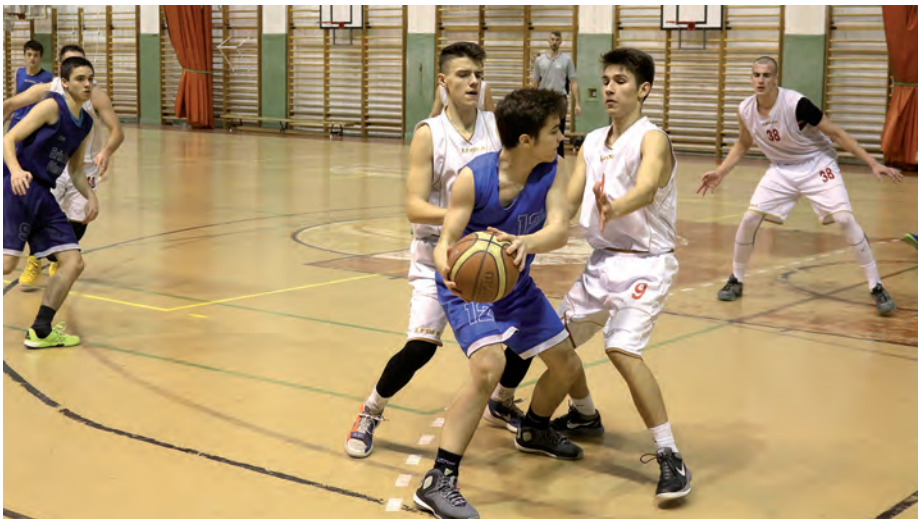
A Szerencs VSE 98–38 arányú győzelmet aratott Gyulai Color KC csapata ellen.

– Nagyon jól. Megvertük a nálunk sokkal magasabban jegyzett Hajdúhadházat. Igazából mi ezért dolgoztunk a téli szünetben, hogy a januári első fordulóban elérhessük ezt a bravúrt.