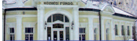
Erzsébet-utalvány és SZÉP kártya elfogadóhely!

A feltüntetett árak az áfát tartalmazzák!