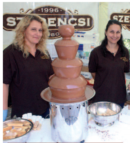
Szerencsi csokoládéban nem volt hiány a három nap alatt.