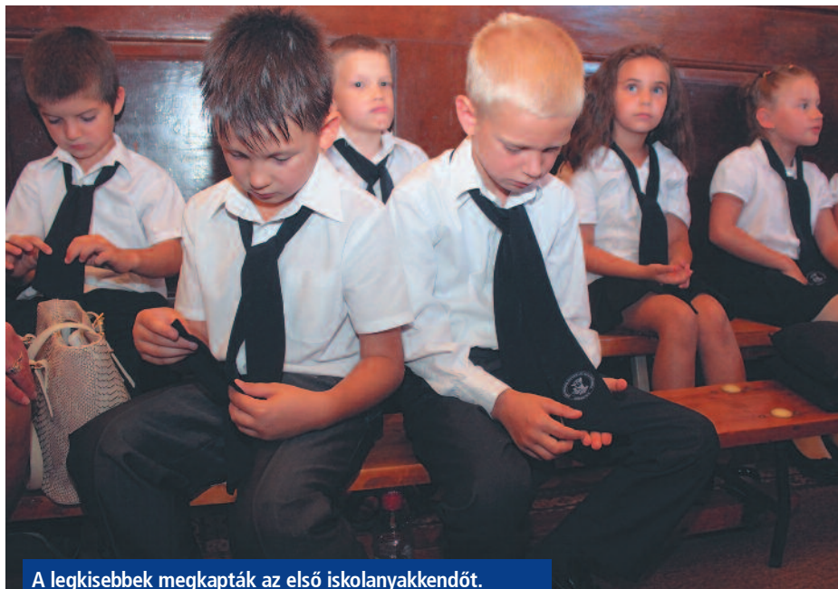
A legkisebbek megkapták az első iskolanyakkendőt.

A szerencsi Rákóczi Zsigmond Református Általános Iskolában szeptember 1-jén 466 diák, közöttük 58 első osztályos kezdte meg a 2015/2016-os oktatási esztendőt. Az intézmény augusztus 30-án megtartott ünnepélyes évnitóján Balázs Pál református lelkész kérte Isten áldását az új tanévre, az iskolákban történő munkára, a pedagógusokra. – Kibontakozó elmét és tudást kérünk gyermekeinknek, hogy meglássák azt a bölcsességet is, amit nem csak a tankönyvekből lehet kiolvasni, s amely így hangzik: a bölcsesség kezdete, az Úrnak a félelme – hangzott el az eseményen.