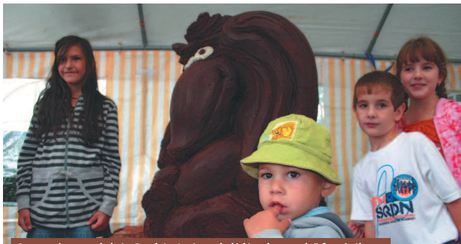
Szerencsi gyermekek és Gombóc Artúr csokoládészobra az első fesztiválon.