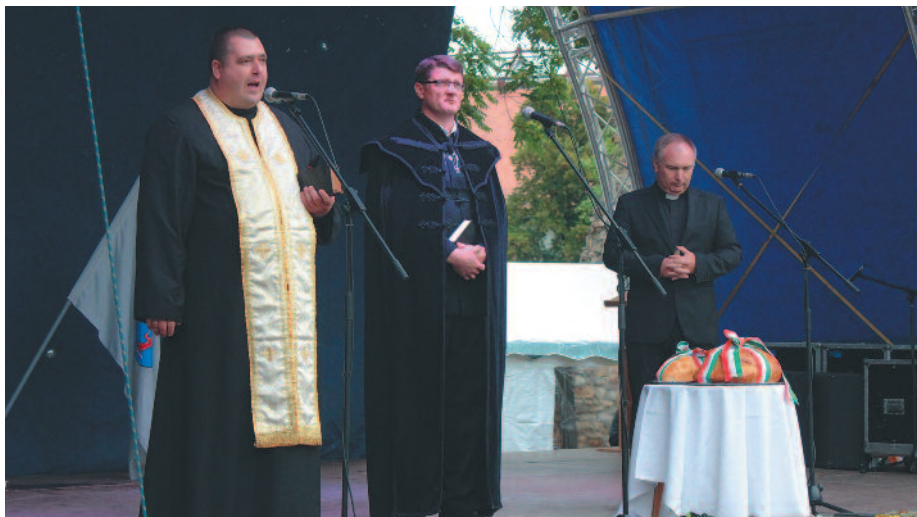
A történelmi egyházak képviselői megáldották és megszentelték az új kenyeret.