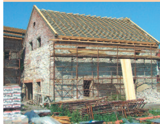
Megkezdődött a tetőhéjazat cseréje is.

Szerencs Város Önkormányzata idén májusban megkezdte a város tulajdonában lévő egykori cukorgyári raktárépület felújítását, hogy ott turisztikai centrumot hozzanak létre. Az uniós forrásból finanszírozott projekt kivitelezője – a Szivárvány-Ép Kft. – augusztus elejére végzett a szerkezeti átalakításokkal, a földszint feletti földem átépítésével, a tetőszerkezet megerősítésével és hőszigetelésével, valamint új homlokzati falnyílások kialakításával. Ezzel egyidejűleg elkészültek az épületgépészeti alapvezetékek, valamint a belső válaszfalak is. Szerencs Város Önkormányzata azzal a céllal újítja fel az egykori cukorraktár épületét, hogy ott a helyi csokoládégyártás történetét bemutató tárlat mellett turisztikai centrumot hozzanak létre.