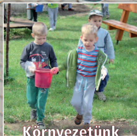
Környezetünk tisztaságáért (cikkünk az 5. oldalon)