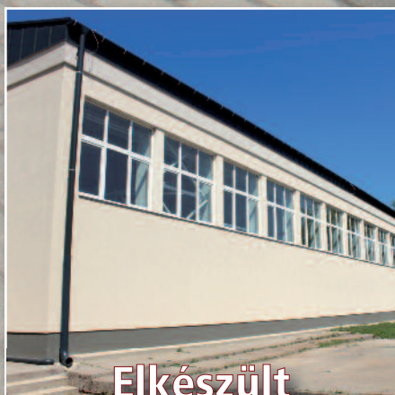
Elkészült a Hunyadi tornacsarnok (cikkünk a 3. oldalon)