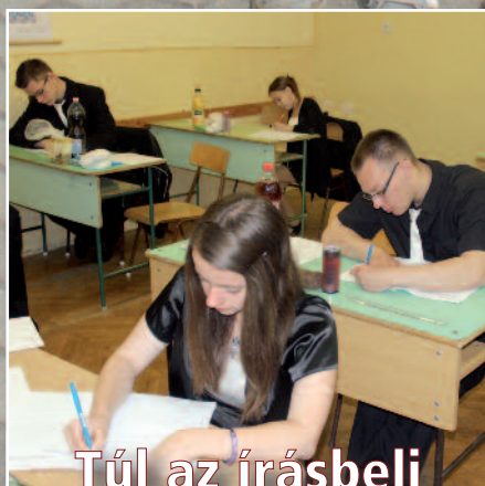
Túl az írásbeli érettségén (cikkünk a 11. oldalon)